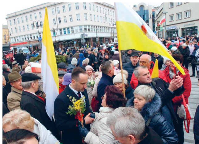
Opole - marsz pamięci świętego Jana Pawła II