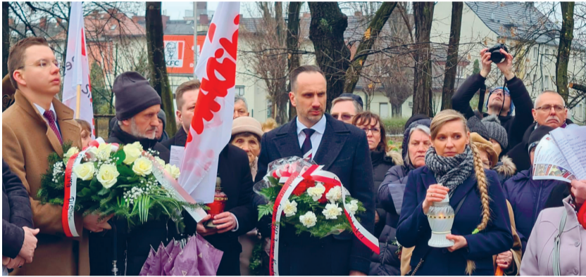
Kędzierzyn-Koźle, 02.04.2023 r.

Dzieci należy chronić przed niebezpieczną i agresywną ideologią gender. Nie ma i nigdy nie będzie mojej zgody na seksualizację dzieci. Szkoła ma przekazywać wiedzę, a nie deprawować. Jako poseł, ale przede wszystkim jako ojciec, zawsze będę walczył o bezpieczeństwo polskich dzieci i trzymanie ich z daleka od skrajnie lewicowej indoktrynacji.