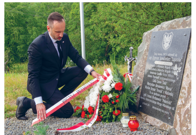
Głubczyce - pamięć o polskich Bohaterach!