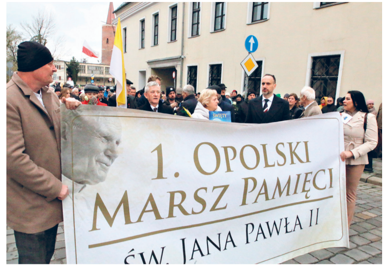
Opole, 02.04.2023 r.

Brukselskie elity marzą, aby zainstalować Donalda Tuska i PO u władzy w Polsce, a następnie zalać Polskę