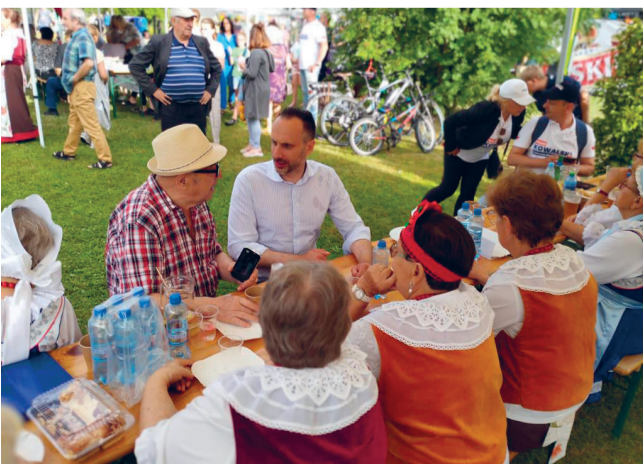
Hajduki Nyskie - piknik i rozmowy z mieszkańcami

OPOLE, BRZEG, KLUCZBORK, KĘDZIERZYN-KOŹLE, NYSA, OLESNO, PRUDNIK, NAMYSŁÓW, GŁUBCZYCE, KRAPKOWICE, STRZELCE OPOLSKIE